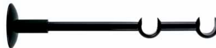
aperto doppio double opened cod. FA263DOPP Ø 20 mm