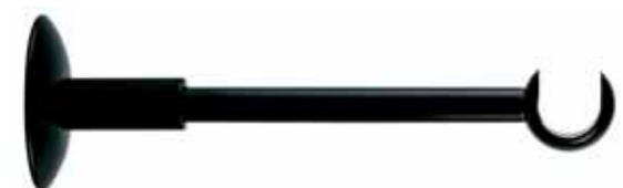
aperto opened cod. FA263 Ø 20 mm