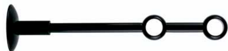
chiuso doppio double closed cod. FA260DOPP Ø 20 mm