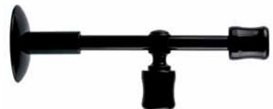
angolare corner cod. FA260ANGO Ø 20 mm