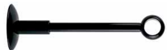
chiuso closed cod. FA260 Ø 20 mm