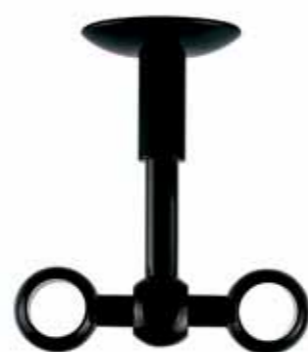
soffitto doppio double ceiling cod. FA260SODP Ø 20 mm