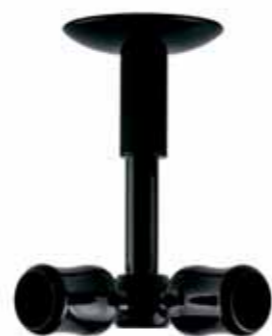
soffitto angolare corner ceiling cod. FA260SOAN Ø 20 mm