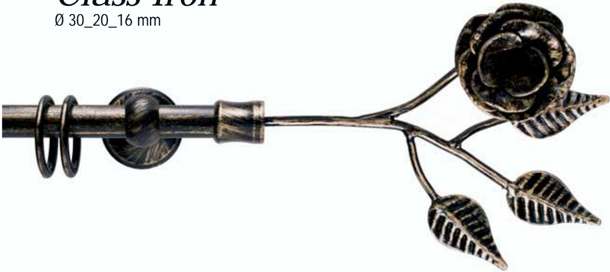
Rosa cod. FB116

Ø 20 mm strappo e tirocorda finitura ferro da 013 a 099 Ø 20 mm handdrawn and corded iron finishes from 013 to 099