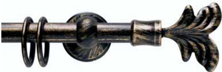
Giglio cod. FB113

Ø 30_16 mm strappo Ø 20 mm strappo e tirocorda finitura ferro da 013 a 099 Ø 30_16 mm handdrawn Ø 20 mm handdrawn and corded iron finishes from 013 to 099