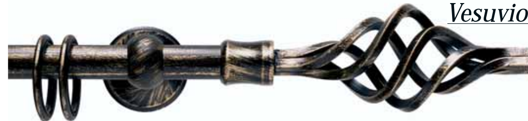
Vesuvio cod. FB122

Ø 20 mm strappo e tirocorda finitura ferro da 013 a 099 Ø 20 mm handdrawn and corded iron finishes from 013 to 099