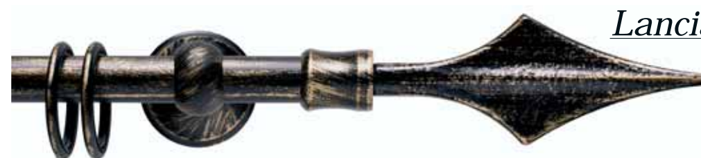
Lancia cod. FB121

Ø 20 mm strappo e tirocorda finitura ferro da 013 a 099 Ø 20 mm handdrawn and corded iron finishes from 013 to 099