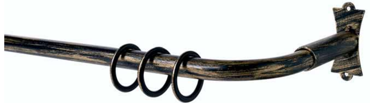
Itaca cod. FB399

Ø 30_16 mm strappo Ø 20 mm strappo e tirocorda finitura ferro da 013 a 099 Ø 30_16 mm handdrawn Ø 20 mm handdrawn and corded iron finishes from 013 to 099