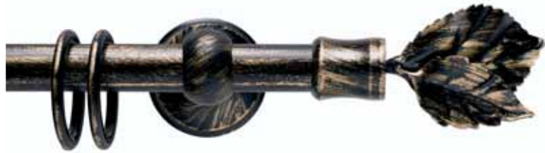
Gemma cod. FB114

Ø 16 mm strappo Ø 20 mm strappo e tirocorda finitura ferro da 013 a 099 Ø 16 mm handdrawn Ø 20 mm handdrawn and corded iron finishes from 013 to 099