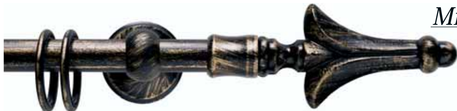
Milano cod. FB127

Ø 20 mm strappo e tirocorda finitura ferro da 013 a 099 Ø 20 mm handdrawn and corded iron finishes from 013 to 099