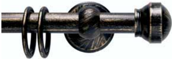
Eros cod. FB105

Ø 30_16 mm strappo Ø 20 mm strappo e tirocorda finitura ferro da 013 a 099 Ø 30_16 mm handdrawn Ø 20 mm handdrawn and corded iron finishes from 013 to 099