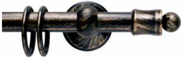
Mignon cod. FB100

Ø 30_16 mm strappo Ø 20 mm strappo e tirocorda finitura ferro da 013 a 099 Ø 30_16 mm handdrawn Ø 20 mm handdrawn and corded iron finishes from 013 to 099