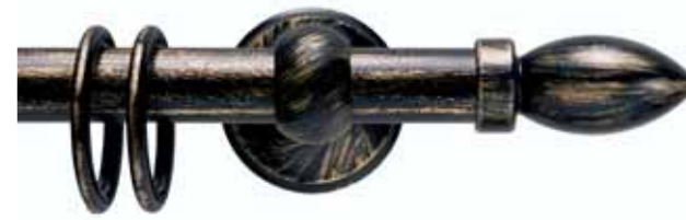
Oliva cod. FB111

Ø 16 mm strappo Ø 20 mm strappo e tirocorda finitura ferro da 013 a 099 Ø 16 mm handdrawn Ø 20 mm handdrawn and corded iron finishes from 013 to 099