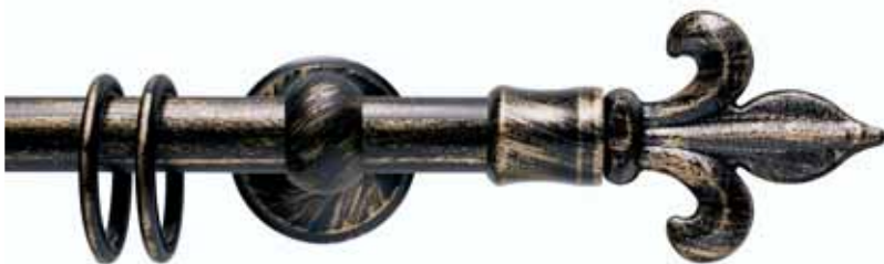
Trieste cod. FB125

Ø 20 mm strappo e tirocorda finitura ferro da 013 a 099 Ø 20 mm handdrawn and corded iron finishes from 013 to 099