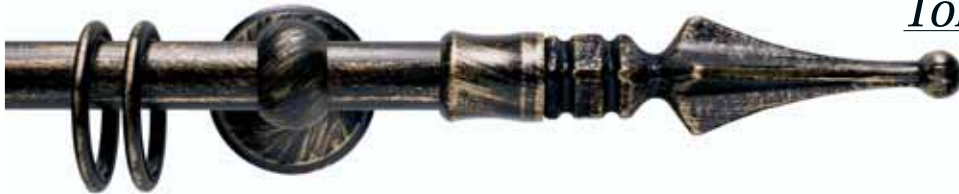
Torino cod. FB126

Ø 20 mm strappo e tirocorda finitura ferro da 013 a 099 Ø 20 mm handdrawn and corded iron finishes from 013 to 099