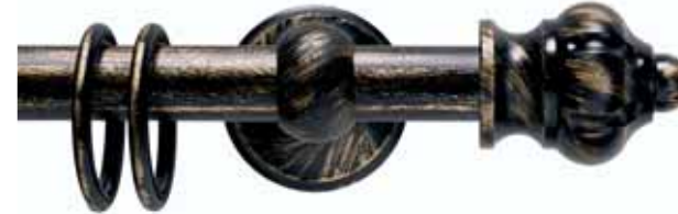
Impero cod. FB123

Ø 16 mm strappo Ø 20 mm strappo e tirocorda finitura ferro da 013 a 099 Ø 16 mm handdrawn Ø 20 mm handdrawn and corded iron finishes from 013 to 099