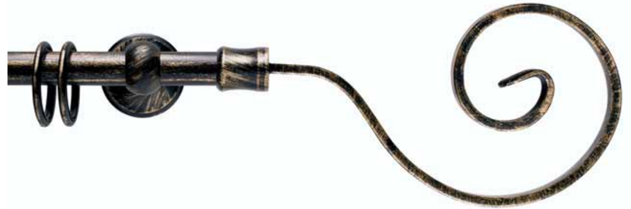
Spirale cod. FB130

Ø 20 mm strappo e tirocorda finitura ferro da 013 a 099 Ø 20 mm handdrawn and corded iron finishes from 013 to 099