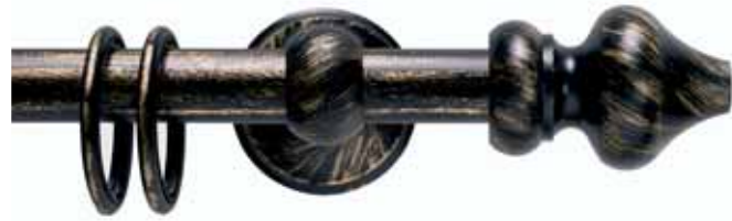
Elisir cod. FB112

Ø 16 mm strappo Ø 20 mm strappo e tirocorda finitura ferro da 013 a 099 Ø 16 mm handdrawn Ø 20 mm handdrawn and corded iron finishes from 013 to 099