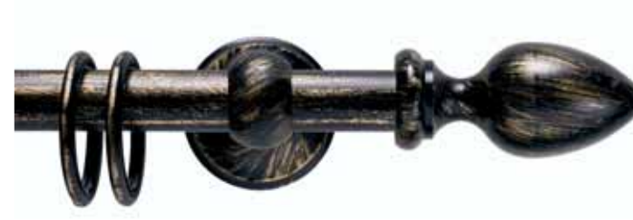
Odissea cod. FB124

Ø 16 mm strappo Ø 20 mm strappo e tirocorda finitura ferro da 013 a 099 Ø 16 mm handdrawn Ø 20 mm handdrawn and corded iron finishes from 013 to 099