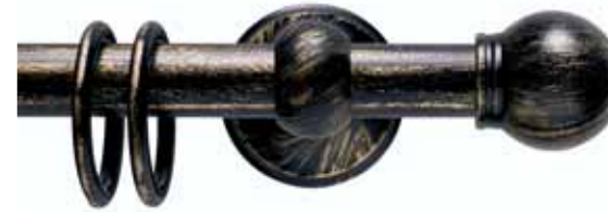
Fosia cod. FB101

Ø 30_16 mm strappo Ø 20 mm strappo e tirocorda finitura ferro da 013 a 099 Ø 30_16 mm handdrawn Ø 20 mm handdrawn and corded iron finishes from 013 to 099