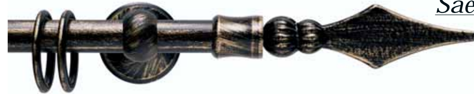
Saetta cod. FB119

Ø 20 mm strappo e tirocorda finitura ferro da 013 a 099 Ø 20 mm handdrawn and corded iron finishes from 013 to 099