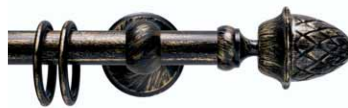
Pigna cod. FB104

Ø 16 mm strappo Ø 20 mm strappo e tirocorda finitura ferro da 013 a 099 Ø 16 mm handdrawn Ø 20 mm handdrawn and corded iron finishes from 013 to 099